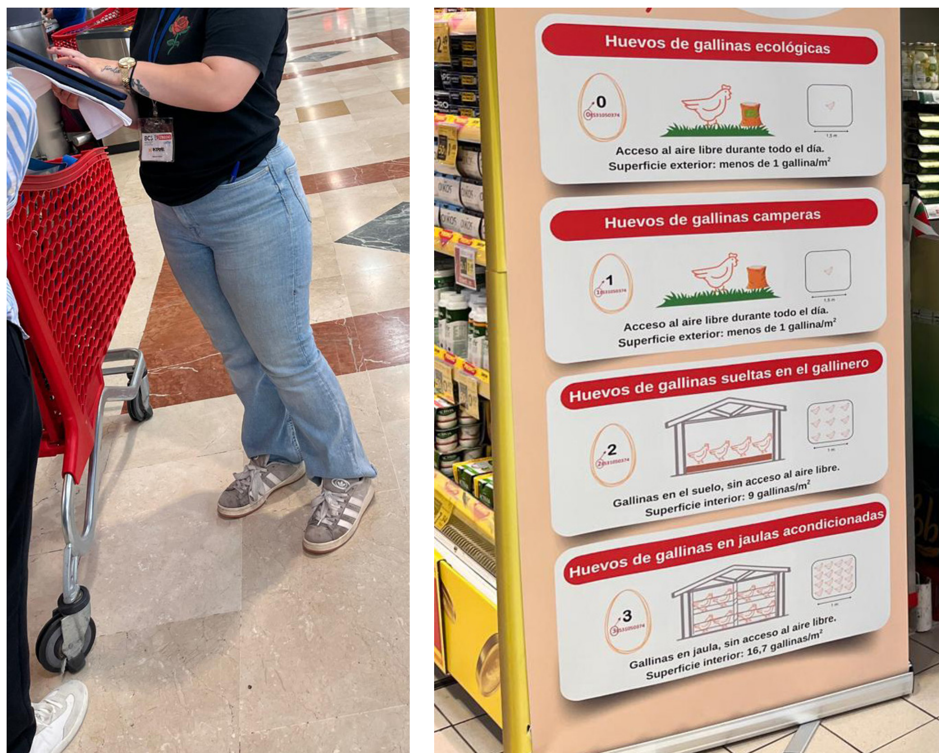
Encuesta sobre proyecto europeo BC3-huevos