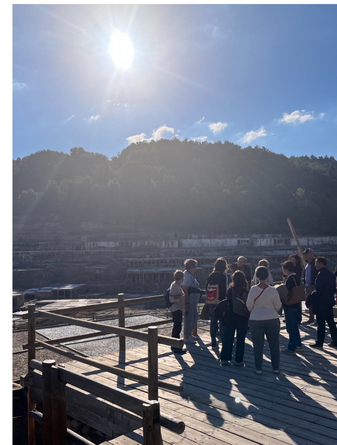
Visita Salinas de Añana