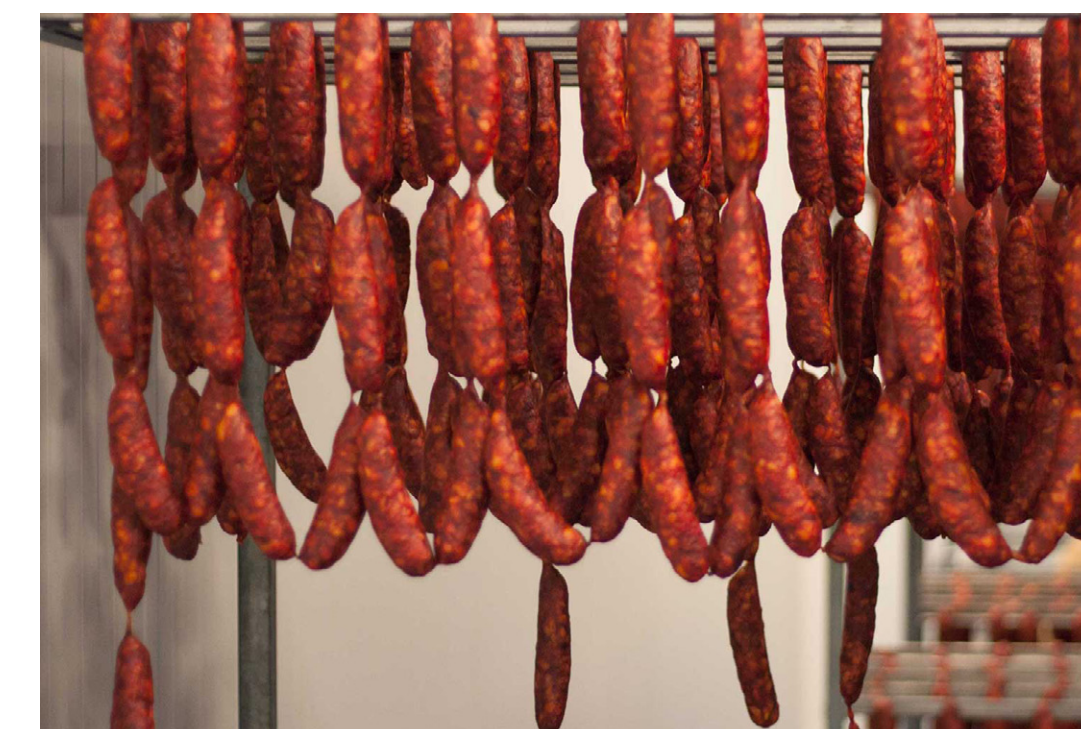
Visita a la fábrica embutidos Arbizu